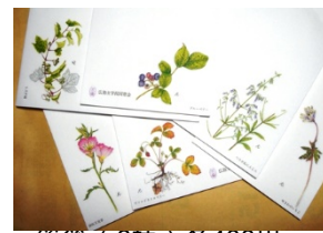
一筆箋 (6柄) 各400円