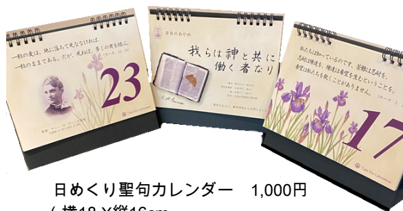
日めくり聖句カレンダー 1,000円 (横18 X縦16cm)