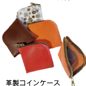
革製コインケース マーク入り 1,900円