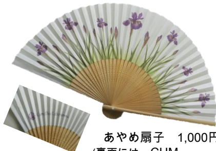
あやめ扇子 1,000円 (裏面には CUM LABORAMUS)