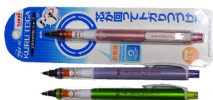
三菱クルトガ・シャープペンシル (ベビーピンク、バイオレット、黄緑 シルバー、ピンクなど) 各450円