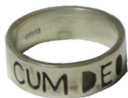
スクール・リング (銀製) (受注制作) 6,000円 (内側刻印1,000円～)