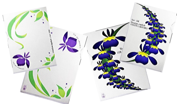
クリアファイルA4 (2柄) 各100円