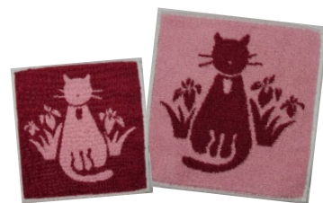
ジャガードタオル・ハンカチ 19cm角リバーシブル) 400円