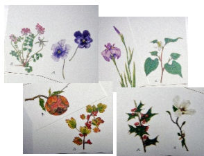
絵はがき : 春、秋、冬、あやめ 2柄2枚ずつ4枚入 各200円