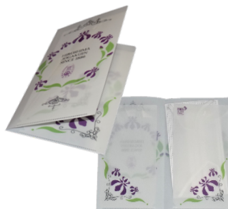
抗ウイルス加工 チケット/マスクケース 200円