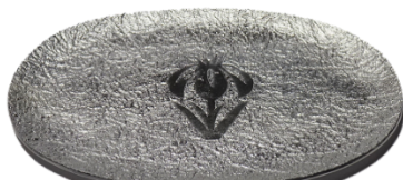
小皿(錫製) 2,400円 12.8×8.7×0.5cm 100g