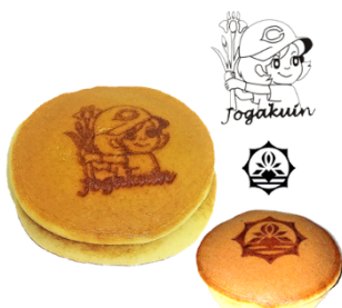
カープ女学院どら焼き 1箱5個入り 900円