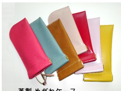
革製 めがねケース マーク入り 2,000円