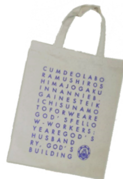
布バッグ(生作り) 600円 (縦34×横21×マチ6cm)