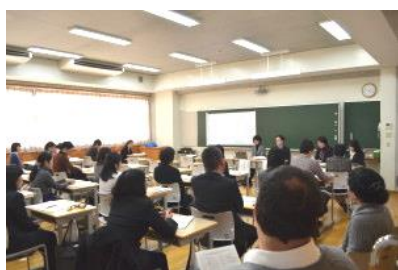
(グローバル教育推進部)